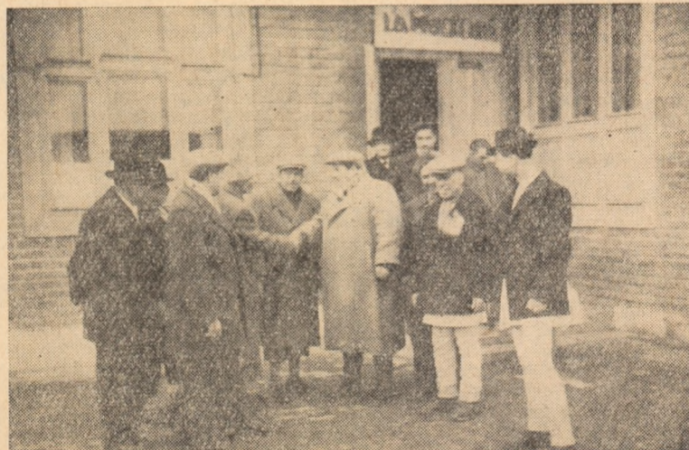
IN CLIȘEU: Conducători ai organelor de partid, de vorbă cu noii colectiviști.

Ne așlăm în momentul de față în perioada cînd în întregul raion trebuie să înceapă acțiunea pentru plantarea pomilor. Sfaturile populare, organizațiile de partid și cele ale U.T.M., organele tehnice agricole, trebuie să fie în fruntea acestei mari acțiuni, mobilizînd tinereții și întreaga țărănime muncitoare din raion la bătălia pentru dezvoltarea pomiculturii raionului și sporirea producției de fructe.