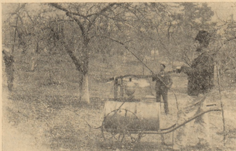
Executarea stropirilor de pomi, la G.A.S. din Oarda de Jos, — trupul Țeina.