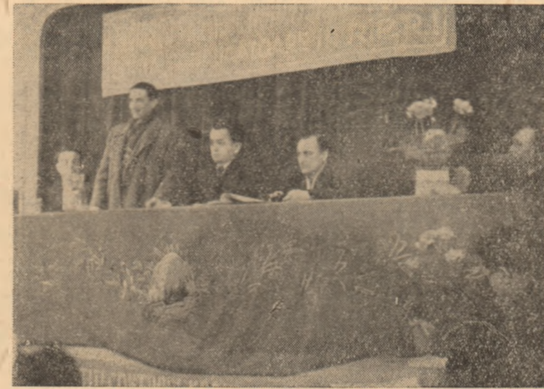
In clișeu: Aspect de la adunarea generală a coop. „Munca nouă”.

Fără de lipsurile mari pe care conducerea cooperativei „Mureșul” le-a manifestat anul trecut e nevoie să se ia de îndată măsuri pentru curmarea lor din rădăcini. Proiectul de hotărâre adoptat de adunare reflectă în mod just sarcinile ce stau în fața conducerii cooperativei „Mureșul”. Iată de ce el trebuie tradus punct cu punct în viață.