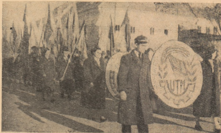
Aspect de la deschiderea „Săptămîni Mondiale a Tineretului”.