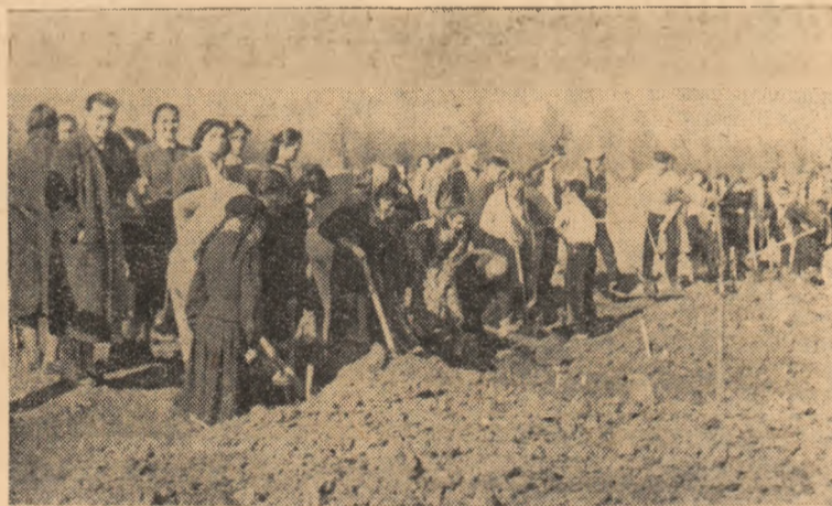
ÎN CLIȘEU: Tineri din orașul Alba-Iulia în „Ziua muncii voluntare” pe șantierul tineretului de la Oarda de Jos.

La 1 iulie, Școala profesională zootehnică de la Galtiu va da agriculturii 25 de noi lucrători zootehniști. Ei sînt hotărîți ca după trei ani de studii să-și aducă din plin contribuția la obținerea de producții sporite, pentru ridicarea nivelului de trai a oamenilor muncii.