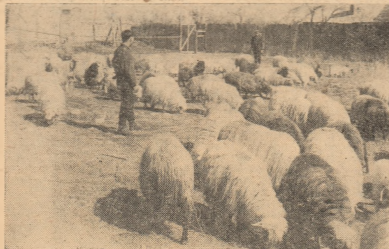
IN CLISEU: O parte din oile gospodăriei colective din Ighiu.

Se străduiesc colectivității din Ighiu și înving. Nimic nu le poate să așchie hotărîrii lor de a face din drumul pe care au pășit, un adevărat drum al deplinelor biruinți.