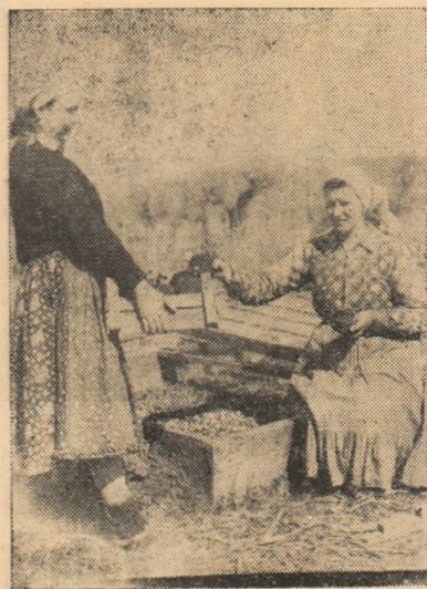
IN CLISEU: La G.A.C. Micești, răsădul plantat în cele 2.000 cuburi nutritive se dezvoltă frumos.

La intrarea în satul Obreja, pe partea dreaptă, ochii trecătorului înfîlesc numeroase cuploare cu cărămidă arsă, gata doar să se înceapă construirea caselor. În continuare pe o parte și pe alta a drumului, se văd un număr mare de case noi, unele terminate complet,