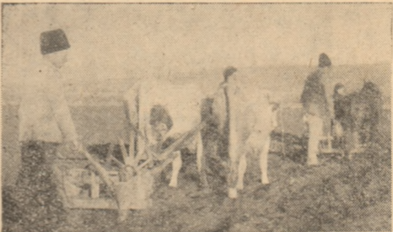
Semănatul în comun a florii-soarelui, soiul VNIIMK, pe terenul repartizat fondului de bază, la întovărirea „Galtiana” — satul Galtiu.

Ținînd seamă de timpul înaintat în care ne găsim, organele de teren ale unității contractante au datoria să asigure de urgență cultivatorilor mașini de semănat corespunzătoare, deoarece orice întîrziere a însămintărilor este dăunătoare, ducînd la scăderea producției de sfeclă de zahăr.