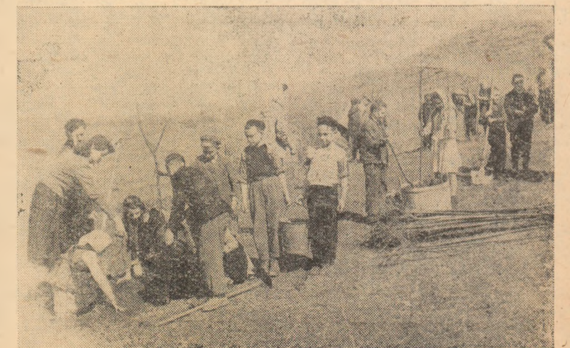
În comuna Ciugud s-au plantat în acest an 2,5 hectare de livadă nouă. În clișeu: Pionierii și școlarii de la școala de 7 ani din Ciugud la plantat de cireși.

Construirea saivanelor este azi o problemă de o deosebită importanță pentru întovăririle zootehnice și ca atare ea trebuie să stea în centrul atenției conducătorilor întovăririlor. Pe baza folosirii surselor locale comitetele de conducere din întovăririi, cu sprijinul masei largi de membri și cu un ajutor mai concret din partea sflaturilor populare comunale, trebuie să treacă neîntîrziat la terminarea acestor lucrări, luțînd cu toate forțele pentru a realiza construcții bune și cît mai ieftine.