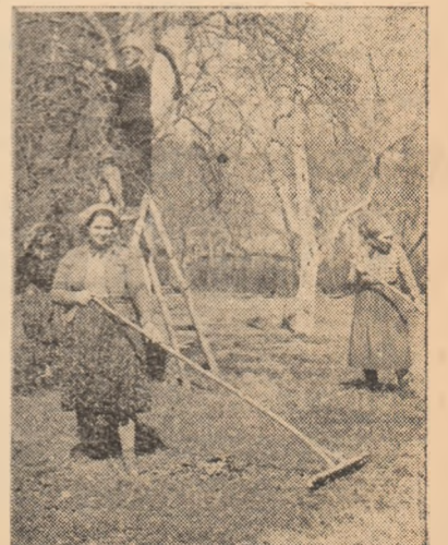
Lucrări în livadă la G.A.C. — Benic

Înlăturarea cheltuielilor inutile este o sarcină a fiecărei conduceri de întreprindere și această sarcină trebuie îndeplinită întocmai, luînd măsuri pentru ca cei vinovați de plata unor cheltuieli neechibuzite să fie aspru trași la răspundere.