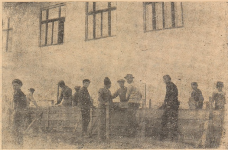
ÎN CLIȘEU: Împrejmuirea cu gard de beton a școlii de 7 ani din satul Cistei, prin contribuție voluntară.

Sarcina bunei întrețineri a drumurilor este o sarcină ce trebuie să se bucure de cea mai mare atenție din partea sfaturilor populare. Ele sînt chemate să asigure prin contribuție în muncă participarea largă a fiecărui țaran muncitor, la întreținerea drumurilor.