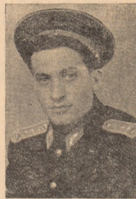
DASCAL ION mecanic Depozit C.F.R. Teiuș