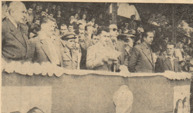
ASPECT DE LA DESCHIDERA FESTIVALULUI

— Ce frumos e! Ce frumoasă e tineretea noastră!