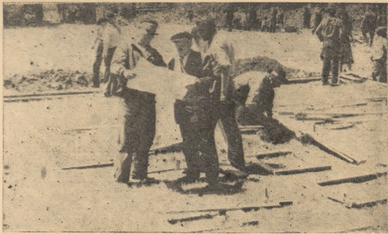
La întreprinderea Zlatna, lucrările de săpături și altă muncă necalificată la cele 3 blocuri muncitorești ce se construiesc se fac prin muncă voluntară.

In satul Galda de Sus, unde organele de partid și Comitetul executiv al Sfatului popular din comuna Benic au muncit cu răbdare și perseverență în rindul țărănimii muncitoare, pentru a-i lămurii despre avantajele muncii unite în întovărășire, rezultatele nu au întârziat să se arate. Astfel, la 22 iunie, 162 de familii de crescători de animale, cu o suprafață de 336 hectare teren agricol și un fond de bază de 162 oi, au pus în satul lor bazele unei întovărășiri agrozootehnice.