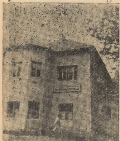
ÎN CLISEU: Noul dispensar din comuna Intregalde, ridicat cu ajutorul statului.

În anii regimului democrat-popular din țara noastră, pentru îngrijirea sănătății oamenilor muncii, se construiesc an de an noi unități sanitare, ce sînt înzestrate cu utilaj și aparatură modernă, deservite de cadre medico-sanitare bine pregătite.