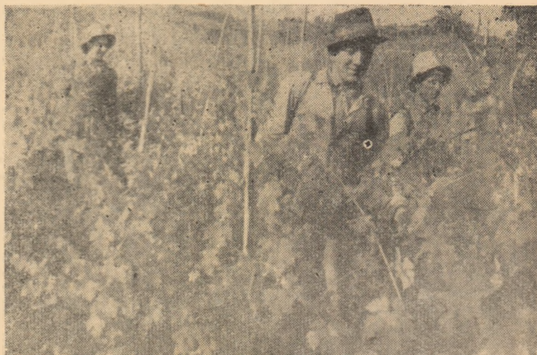
IN CLIȘEU: Stropitul viei la gospodăria colectivă „Viața nouă” din Telna

Gazetele de perete sînt instrumente principale de luptă ale organizațiilor de bază. De aceea, acestea au datoria să îndrume și să sprijine în permanentă colectivele de redacție, analizînd periodic activitatea lor și îndrumîndu-le în așa fel ca gazetele de perete să devină adevărate tribune ale experienței înaintate, un mijloc important de agitație politică. Este necesar ca organizațiile de partid să urmărească îndeaproape îndeplinirea planurilor de muncă să analizeze eficacitatea materialelor publicate, să vegheze ca materialele ce se publică să fie strîns legate de mărețele sarcini pe care le ridică etapa actuală a construcției socialiste în țara noastră.