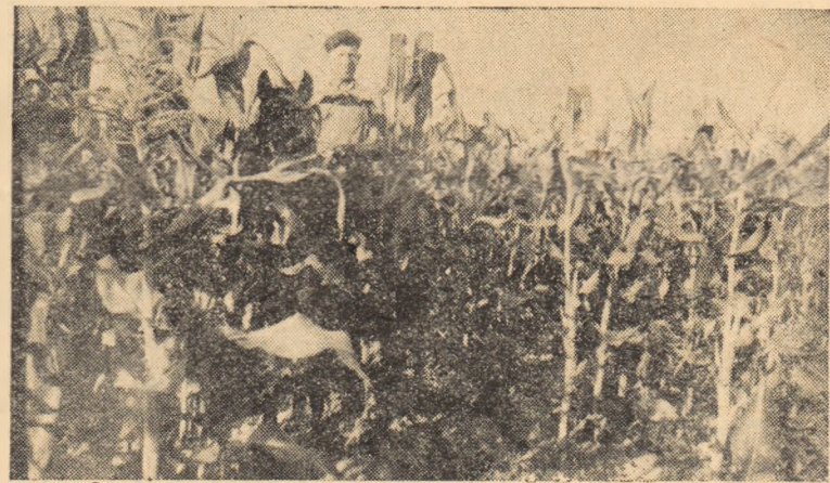
Bine dezvoltat, porumbul hibrid al gospodăriei agricole de stat din Oarda de Jos a întrecut înălțimea calului de călăreț cu tot.

Închinat zilei eliberării, noul program oglindește viața lumioasă a comunei, marile realizări împlinite în Vințul de Jos în anii regimului democrat-popular.