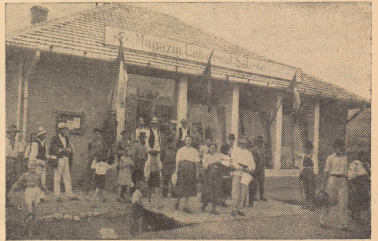
Magazinul Universal din Benic — primii cumpărători,

Acum, în prag de sărbătoare, oamenii Benicului au un nou magazin, un magazin mare și frumos. În locul vechiului local, mic și neîncălzit, a apărut ca din pămînt, aproape de centrul satului, un local cu care beniceni se pot mîndri pe bună dreptate. Deci în cronica satului o nouă realizare a fost consemnată.