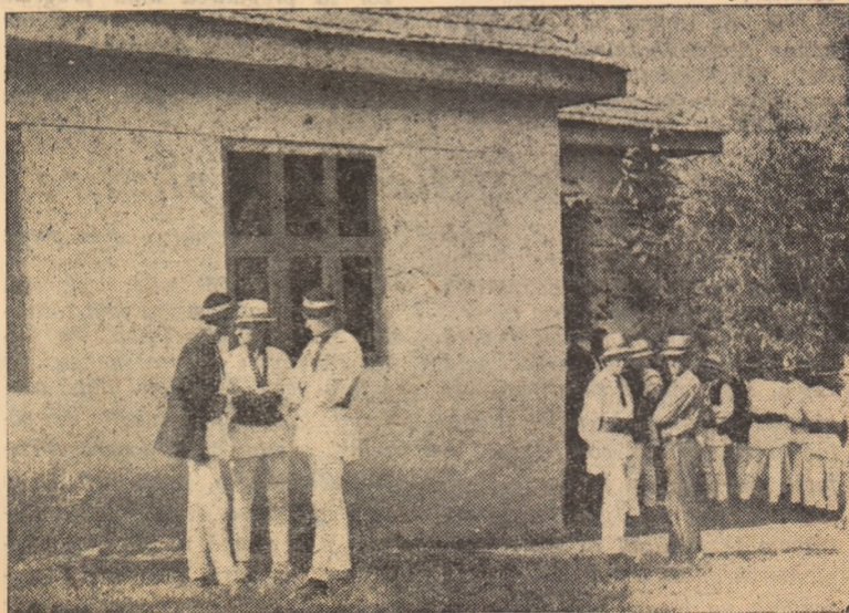
La noul cămin cultural din Cib, sîntenii își petrec plăcut și cu folos zilele de odihnă.