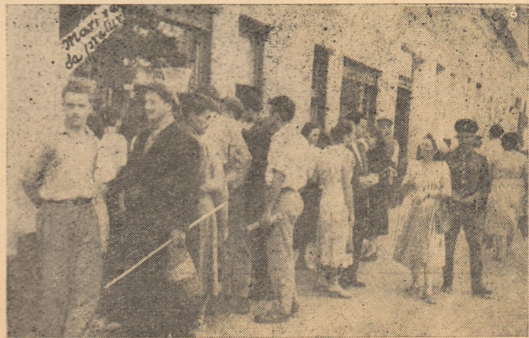
În prima zi după alinișirea noilor prețuri reduse.

Sărbătorind Ziua minerului, bravii miniere din raionul nostru au făcut din angajamentul luat un legămint și, ca mulțumire pentru viața fericită pe care o trăiesc, vor lupta pentru izbînză și mai mari în viitor, pentru succese demne de înaltă prețuire de care se bucură acest harnic și de nădejde detașament al clasei noastre muncitoare.