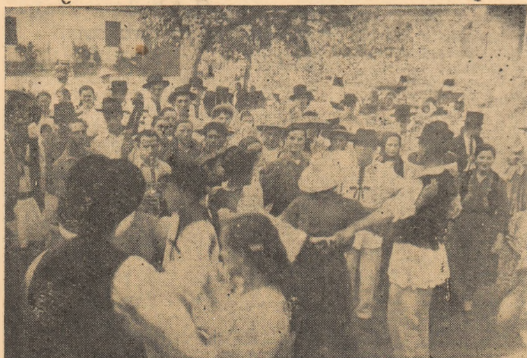
Cei veniți să participe la sărbătorirea împărțirii avansului s-au prins și ei în joc cu colectivitățile din Ţelna.