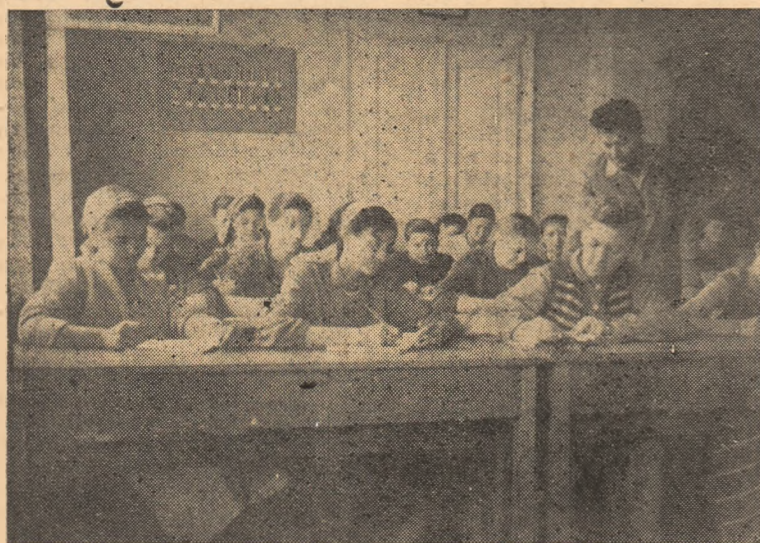
La Școala profesională a cooperatist, din Alba-Iulia, viitoarele cadre pentru comerțul cooperatist se pregătesc teinic.

Vas'a rețea de magazine, bună aprovizionare a acestora, la care se adaugă creșterea puterii de cumpărare a maselor, au condus la sporirea volumului de mărfuri desfăcute. Așa, de pildă, volumul produselor alimentare desfăcute în raionul nostru a fost mai mare în 1958 față de 1952 cu 68 la sută, deosebit de semnificativ fiind situația consumului de carne, preparate de carne, grăsimi și zahăr.