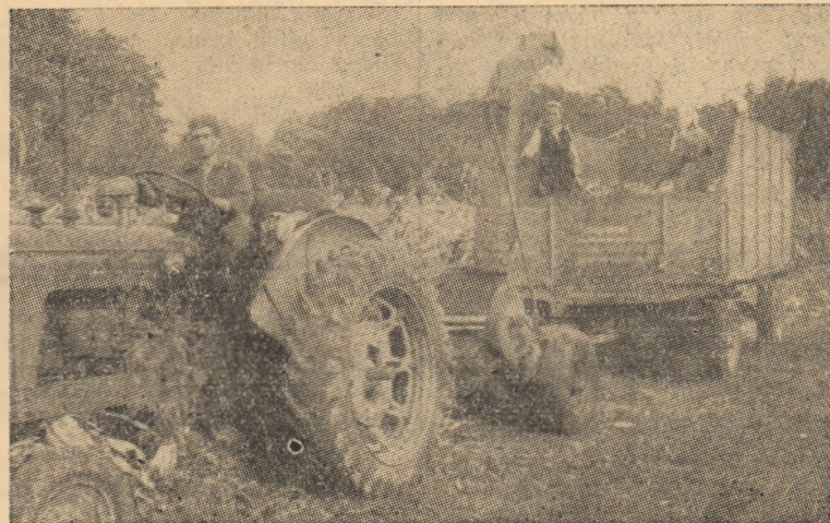
Concomitent cu recoltarea porumbului, la G.A.S. Galda se urgențează și însilozarea paielor de porumb, folosindu-se în acest scop combina cu remorcă

Astfel, după terminarea lucrului, numeroși muncitori și funcționari de la întreprinderile „Horia“, „I-prodecoop“, „Munca nouă“, U.R.C.C., Atelierul „Ardealul“, Spitalul Unificat, O.C.L. Produse industriale, fabrica „Ardeleana“ și alte unități din oraș au efectuat în mod voluntar culesul porumbului de pe suprafața de peste 50 ha. Merită apoi a fi scos în evidență faptul că, în dorința de a sprijini gospodăria de stat, la culesul porumbului au participat și un mare număr de țărani muncitori din Mihaiț, precum și colectiviștii din cadrul gospodăriei colective din satul Obreja.