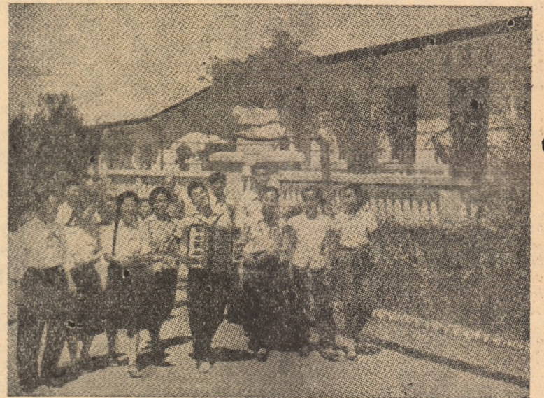
Lucrători din domeniul învățămîntului își petrec vacanța la Beidaihai, o stațiune balneară pe litoral.

În prezent lucrătorii restaurantului continuă să dezvolte inovațiile tehnice.