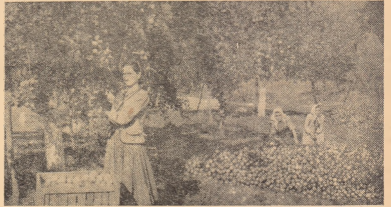
În acest an, la gospodăria agricolă de stat din Oarda de Jos s-a obținut o recoltă bogată de mere. ÎN CLIȘEU: Recoltarea merelor la subsecția Telna.

Ținînd seamă de timpul înaintat în care ne găsim, organele de partid și de stat din comuna Oarda de Jos, trebuie să sprijine cu toată hotărîrea conducerea întovărășirilor la arături și însămințări, lucrări care trebuie să se termine într-un timp cât mai scurt.