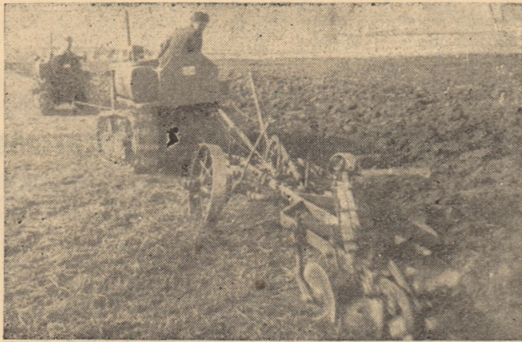
În clișeu: Cuplaj de două tractoare la G.A.S. Galda de Jos, executînd ogor de toamnă la adîncimea de 40 cm. pe lotul experimental.