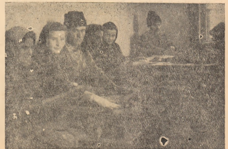
Colectivștii din Obreja, realizează de la cultura tutunului venituri importante. În clișeu: Colectivștii execută clasarea tutunului.

Mergînd pe linia îmbunătățirii metodelor de muncă, pe antrenarea tuturor femeilor la activitatea politică, economică și social-culturală, comitetul raional al femeilor va obține rezultate și mai bune în munca cultural-educativă a masei de femei.