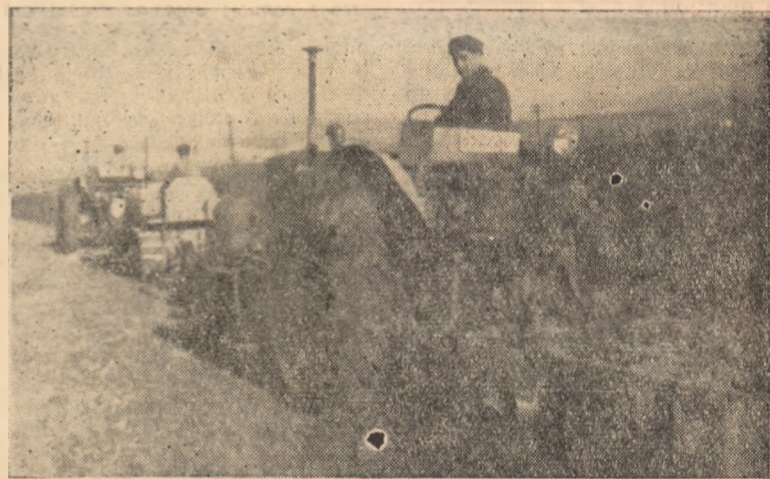
La G.A.C.-Cistei arăturile de toamnă se desfășoară din plin.

Organizată pe baze științifice, expoziția „Construirea socialismului” este deosebit de valoroasă și ea își aduce un prețios aport la educarea maselor în spiritul dragostei față de patrie, a atașamentului față de partid și a respectului față de munca socialistă.