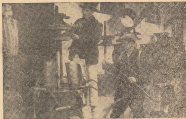
La baza interrațională din Alba-Iulia se găsesc numeroase mașini și unelte agricole la prețuri avantajoase.

Oamenii muncii din orașul și raionul nostru urează Conferinței orășenești de partid succes deplin în desfășurarea lucrărilor.