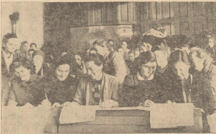
IN CLISEU: La una din lecțiile de la cercul de croi din Teiuș.

Astfel, cu fiecare lecție predată cursantele își însușesc cunoștințe tot mai prețioase, care își vor găsi o largă aplicare în munca lor de bune gospodine.