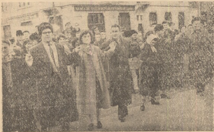
Tinerete dragă-mi ești, tinerete...

Pentru viitor ei și-au propus să strîngă încă 30.000 kg fier vechi și să efectueze cel puțin 100.000 ore muncă patriotică.