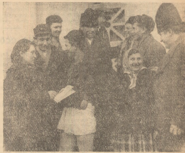
Părerii, impresii — cite nu au să-și împărtășească delegații.