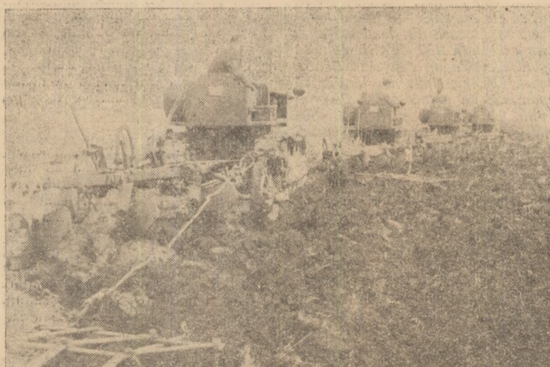
Pe ogoarele gospodăriei agricole de stat din Galda de Jos arăturile se desfășoară din plin.

In clișeu: Insula Ada Kaleh, pitorese colț al frumoasei noastre patrii.