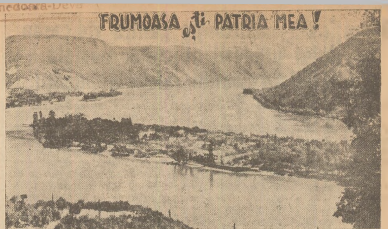
FRUMOASA PATRIA MEA!

In clișeu: Insula Ada Kaleh, pitorese colț al frumoasei noastre patrii.