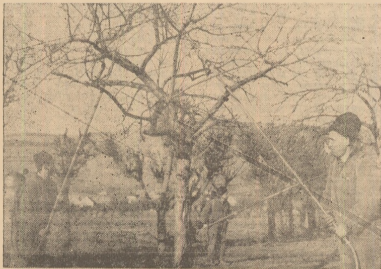
Stropitul pomilor are o mare importanță pentru sporirea producției de fructe. În câmp: Stropitul pomilor la Șard.

Ținînd seamă de importanța acestor lucrări, hotărîtoare pentru fertilitatea solului și ferirea culturilor de inundații, comitetul executiv al sflatului popular din comună, sprijinit și îndrumat de comitetul comunal de partid, trebuie să ia asemenea măsuri ca, paralel cu lucrările în câmp, să fie terminate într-un timp cel mai scurt și lucrările de adîncire și rectificare a văii Craivei.