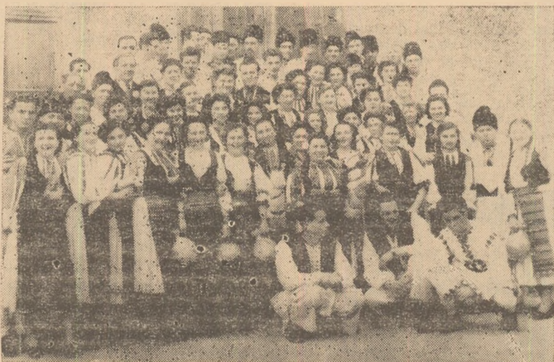
ÎN CLIȘEU: Ansamblul artistic al comitetului sindical al lucrătorilor din comerțul de stat din orașul nostru.