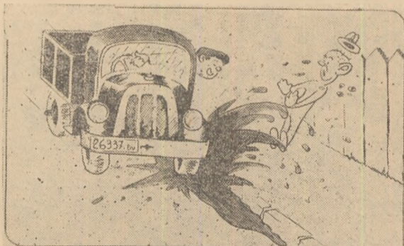
Deși-i murdar costumul tău festiv, e de spălat... șoferul respectiv.