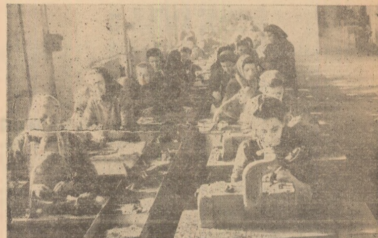
La fabrica „Ardeleana” din Alba-Iulia, printre măsurile luate pentru creșterea productivității muncii este și instalarea benzii rulante la secția richituit. În curînd, o asemenea bandă va fi instalată și la secția finis.

De atunci au trecut 40 de ani. Legendara locomotivă „Comunardul roșu” a parcurs zeci de mii de kilometri. Nu de mult ea a fost predată spre păstrare depoului de locomotive din Celeabinsk. (Agerpres).