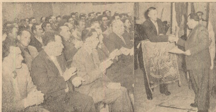
ÎN CLIȘEU: Aspect de la festivitatea înmînării drapelului.

tivitatea înmînării drapelului de „I.G.O. fruntașă pe regiune”. Unui număr însemnat de muncitori li s-au dat diplome de fruntași și premii în bani.