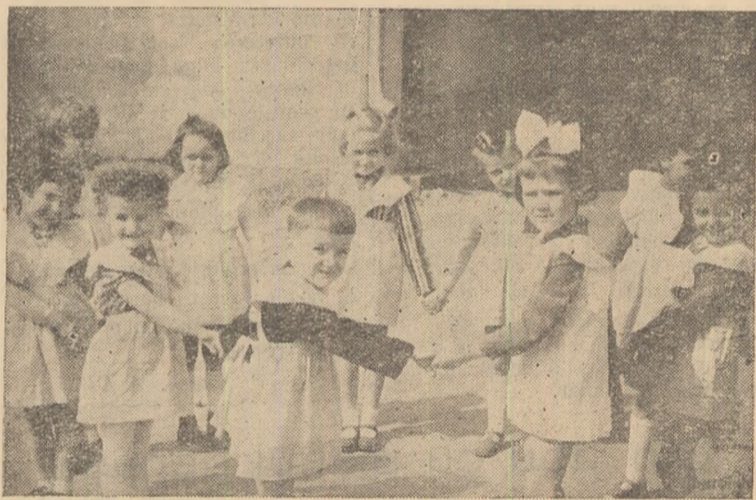
La căminul de zi — Alba-Iulia. Cîntec, joc și voie bună.

Cînd soarele se îndreaptă spre apus, copiii de la căminul de zi din Zlatna întind din nou mîinile spre mamele și tații care-i așteaptă în porțile căminului. Se îndreaptă spre casă ducînd cu ei încă o zi dintr-o copilărie fericită, dăruită lor de partid.