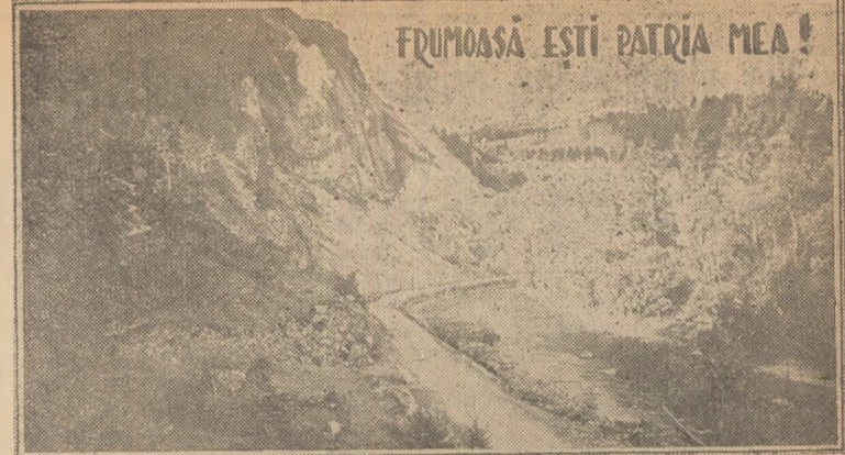
FRUMOASĂ ESTI PATRIA MEA!

Noul dispozitiv are proprietatea transformării și redresării curentului alternativ în curent continuu necesar funcționării defectoscopului electromagnet la verificarea osiilor de vagoane și a standului de probat ventile la frîne automate pentru vagoane. Prin punerea în aplicare a acestei inovații se rușese a se realiza o economie de circa 6000 lei lunar.