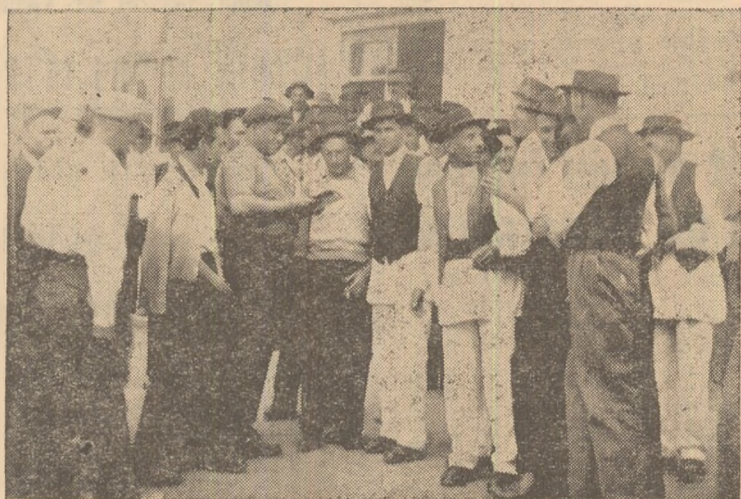
Dezbaterea proiectului de Directive ale celui de-al III-lea Congres al P.M.R., a atras la căminul cultural din Cistei un număr mare de colectivști.

Analizînd posibilitățile care le are gospodăria, colectivității din Cistei și-au propus ca în anul 1965 să ajungă la numărul de 140 vaci, 107 porci, 1.400 oi, peste 5.000 păsări.