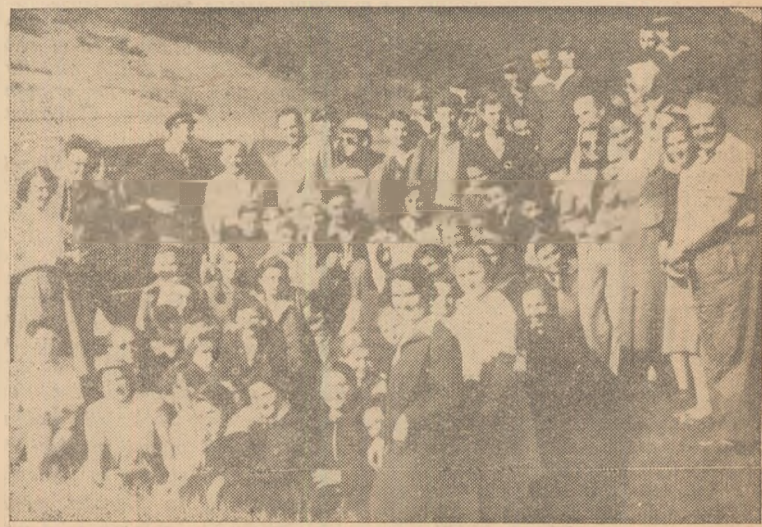
Un mic popas în fața... obiectivului.

Prin paragina aceasta — neputînd s-o ocolească — vine totuși să se plimbe ...critica cetățenească.