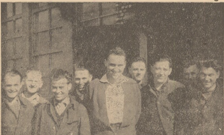
IN CLIŞEU: Cîțiva din fruntașii secției I-a chimice de la Uzinele Metal-Chimice Zlatna.

...La cererea publicului din oraşul nostru, echipa artistică a sindicatului comerŃ va evolua din nou pe scena Casei raionale de cultură duminică 26 iunie, orele 20.30.