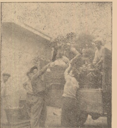
Legumele proaspete iau drumul unităților de desfacere.

pe care s-a luat recolta de cartofi timpurii, gulii, etc., veniturile gospodăriei vor crește și mai mult.