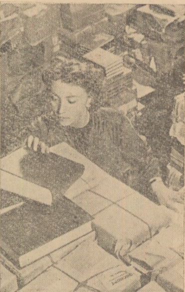
Cărțile rusești sînt mult cerute în numeroase țări ale lumii. În foto: Pregătirea în vederea expediției Dicționarului limbii ruse în Canada și Belgia.

Orașul Sümeg păstrează numeroase monumente ale trecutului, dar industria lui în plină dezvoltare, viața lui culturală îl încadrează în ritmul impetuos al vieții de azi a întregii țări.