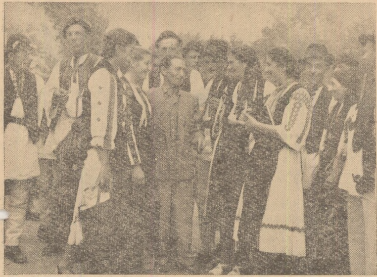
Înainte de a apărea pe scenă. Discuții prietenești între tinerii participanți la concursul cultural sportiv.