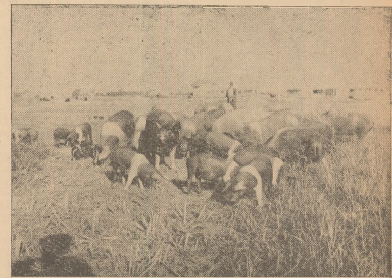
O parte din scoafele de prăsilă și tineretul perîn a G.A.C.-Cistei.

În întreaga lor activitate, organizațiile U.T.M. vor trebui îndrumate