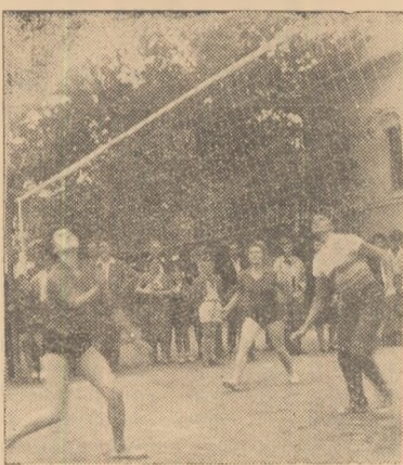
IN CLIȘEU: Fază a întrecerii la vlei-fete.

Concomitent cu disputa de pe scena Casei raionale de cultură, terenurile de sport din orașul nostru au cunoscut și ele animația întrecerii. Și, cum a fost și firesc, pe primul loc s-au clasat sportivii cei mai bine pregătiți pentru concurs. La fotbal, jucînd în finală cu Aurul Zlatna, fotbalisții de la A.S.M. Alba-Iulia au dispus de zlatneni cu 4-2, la volei băieți, cîștigători s-au clasat, de asemenea, sportivii de la A.S.M. Alba-Iulia, iar la volei fete, primul loc a revenit sportivelor de la Asociația „23 August” Bărbant.