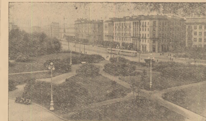
Prin U.R.S.S. orașul Leningrad. În foto: Prospektul Slacek.