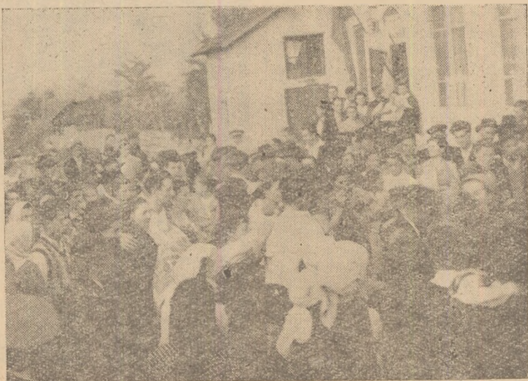
La Galda de Jos, sărbătorirea zilei de 23 August și inaugurarea G.I.C. „Progresul” au atras la cîmîinul cultural un număr mare de țărani muncitori.

Cînd doi oameni fac un lucru fără nici o unitate este clar că fiecare a gîndit... pe jumătate.