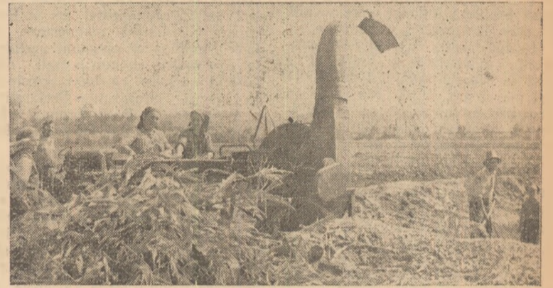
IN CLIȘEU: Însilozarea porumbului la G.A.C. — Cistei.

al gospodăriei, îndrumat de organizația de bază, are toate condițiile să-și organizeze munca pe două schimburi și să intensifice simțitor ritmul de însilozare, să-și asigure nutreț însilozat de bună calitate și în cantități sporite.