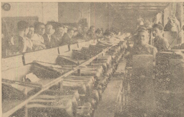
IN CLIȘEU: Noua bandă rulantă de la secția finisaj — fabrica „Ardeleana” din orașul nostru.

Participanții la adunare au aprobat apoi în unanimitate o moțiune adresată C.C. al P.M.R. și Consiliului de Miniștri al R.P.R., în care își exprimă întreaga aderență față de politica externă a R.P.R., urînd din inimă succes deplin delegației poporului român în frunte cu tovarășul Gheorghe Gheorghiu-Dej la cea de-a 15-a sesiune a Adunării Generale O.N.U.