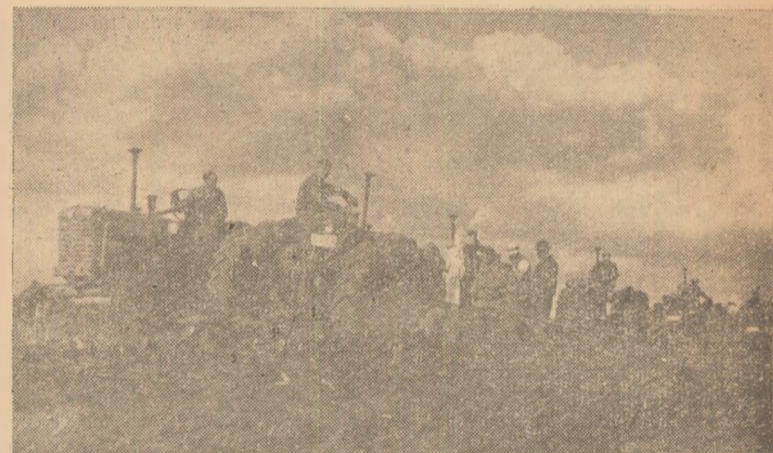
In clișeu: Pregătirea terenului pentru însămînțări la G.A.C. — Șeușa

Ținînd seamă de posibilitățile mari pe care le are, consiliul de conducere al gospodăriei, îndrumat de organizația de partid, trebuie să-și organizeze în așa fel munca pentru a termina însămînțările într-un timp cît mai scurt.