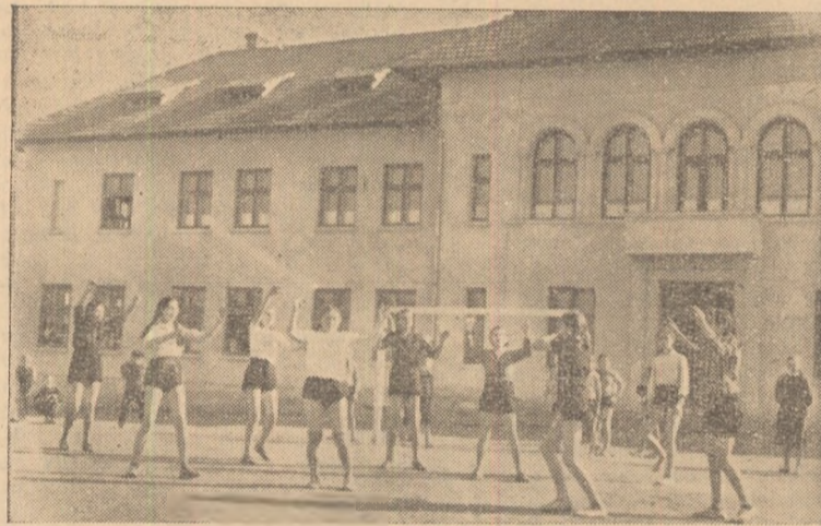
IN CLIȘEU: La o oră de sport la Școala medie din Teiuș.