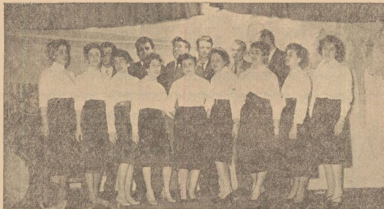
Brigada artistică de agitație de la I. M. „Gh. Doja” Zlatna, prezintă programe tot mai reușite în fața muncitorilor.