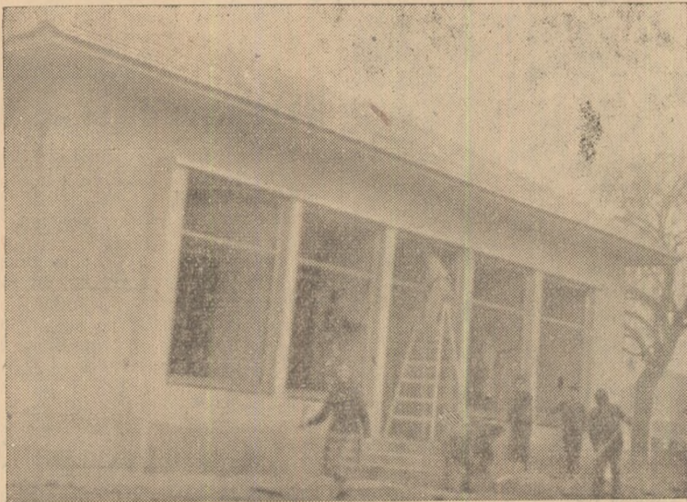
IN CLIȘEU: Noul magazin al Cooperativei din Hăpria, construit cu contribuția țărănilor muncitori din sat.