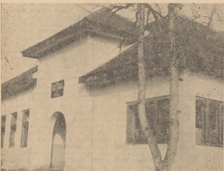
ÎN CLIȘEU: Școala de 4 ani din satul Te'na.