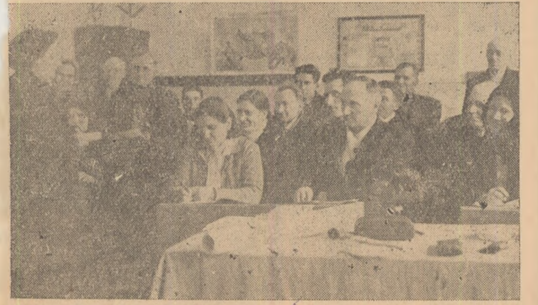
Cercul agrotehnic de la Bărbănt — la o oră de curs.