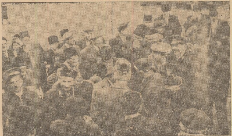
Aspect de la inaugurarea gospodăriei colective „Galtiana”.

litică pe o treaptă și mai înaltă, astfel ca întreaga perioadă ce ne desparte de data alegerilor să fie o perioadă cît mai activă pe linia înfruntării sarcinilor planului de stat pe 1961, pe linia pregătirii campaniei de primăvară și în general pe linia îmbunătățirii întregii activități economice și politice. În această perioadă crește în mod deosebit sarcinile agitației politice de masă și în mod special rolul agitatorilor în ridicarea activității politice de educare comunistă a oamenilor muncii și popularizarea mărețelor înfruntări ale poporului muncitor, sub conducerea partidului nostru. Cu ajutorul agitatorilor, organizațiile de partid duc zi de zi munca de lămurire a politicii partidului și guvernului, contribuie la ridicarea conștiinței socialiste a oamenilor muncii de la orașe și sate, mobilizîndu-i la îndeplinirea sarcinilor construcției economice și culturale ce se desfășoară în țara noastră.