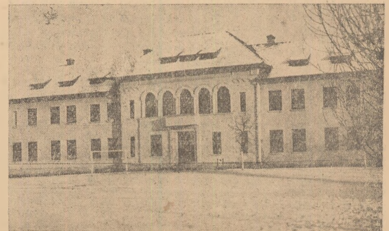
Școala medie din comuna Teiuș.

Așadar, și numai o privire sumară peste șirul cifrelor e edificatoare. Anii pufării populare sînt anii profundelor transformări, sînt anii de tot mai multe bucurii. Iată de ce, alături de întregul popor, teiușenii privesc viitorul cu toată încrederea. El le va aduce noi bucurii.