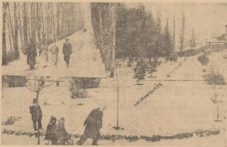
La Teiuș, în apropierea gării, pe terenul unde odinioară era mlaștină și depozit de gunoaie, a fost amenajat un frumos parc.

★ La numai 60-70 se mîrginea cifra abonaților radio în anii 1937-38. Costul aparatelor radio, importate de altfel, se ridica la sume inaccesibile maselor largi de oameni ai muncii, aparatul de radio fiind de altfel în acele vremuri un obiect de lux.