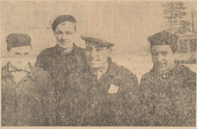
Secția mecanică de la I.L.L. „Horia” Alba-Iulia a cîștigat luna trecută titlul de secție fruntașă. În clișeu: grup de muncitori din secție.

Au mai luat, de asemenea, ființă gospodării colective la Sintimbru și Hăpria, unde țărani muncitori din aceste sate au înscris tot pămîntul lor, în suprafață totală de peste 800 hectare.