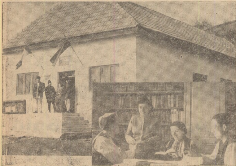
Metes — căminul cultural construit în anii puterii populare și un grup de cititori la bibliotecă.