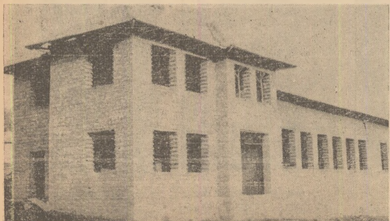
Ampoița — căminul cultural în construcție.

★ În acest an la Feneș va începe construcția unei școli de 7 ani, urmînd ca actualul local al școlii să fie amenajat pentru cămin cultural.