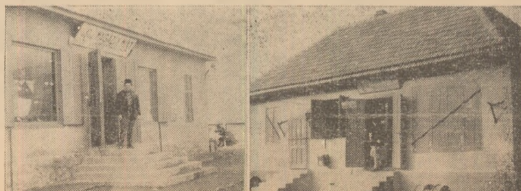
La Ampoița și Galați au fost construite noi localuri de cooperative.