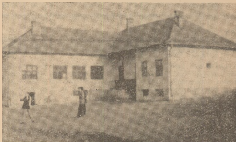
La Galați, unde altă dată copiii nu aveau unde să învețe, s-a construit în anii puterii populare o școală nouă.