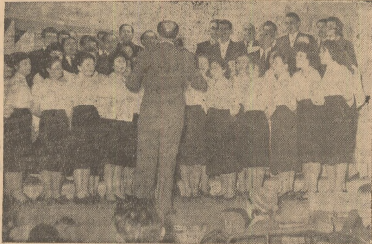
IN CLIȘEU: Corul mixt al U. M. C. Zlatna.

Colectivul uzinelor Metal-Chimice Zlatna este hotărît să îndeplinească de a 40-a aniversare a partidului cu rezultate tot mai bune în muncă. De altfel, acest lucru este oglindit și de angajamentele luate în întrecerea socialistă în cinstea marelui eveniment. Harnicul colectiv de aici și-a propus să dea pînă la 8 mai în sectorul metalurgic peste 70 tone produse, iar în sectorul chimic, de asemenea, peste 70 tone produse peste plan. În cinstea aniversării partidului colectivul de muncă de aici și-a mai propus să realizeze și peste 180 de mii lei economii. Sînt angajamente frumoase și pe care întregul colectiv se va strădui să le îndeplinească. Și nu începe îndoială că se va ține de cuvînt. Chezășie stau faptele de pînă acum, stă hotărîrea comuniștilor, a tuturor muncitorilor de a dăru-i din toată inima partidului cele mai frumoase victorii.