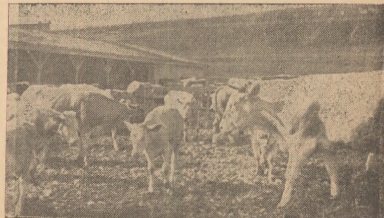
O parte din tineretul taurin al G. A. S. — Galda de Jos.