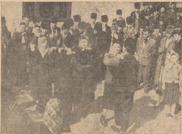
Hăpria în fața secției de votare, joc și vroiosie.