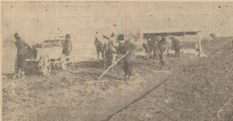
ÎN CLIȘEU: Construirea drumului de acces la construcțiile din sectorul zootehnic de la G.A.C. — Teiuș.

— Pentru ridicarea calificării muncitorilor să organizeze un curs cu durată de 6 luni.