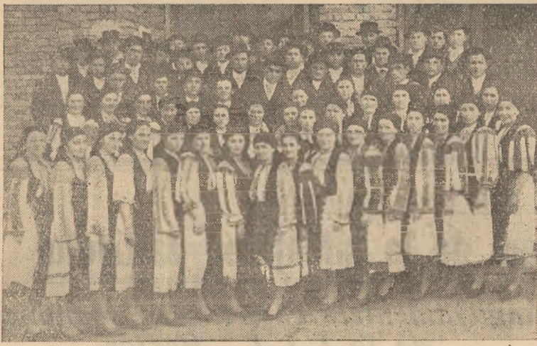
IN CLIȘEU: Corul colectivilor din Obreja.

Față de trecut, numărul formațiilor artistice a crescut. Ele s-au prezentat la concurs cu un repertoriu mai ales, mai bine conturat, iar activitatea lor premergătoare concursului a fost deosebit de rodnică.