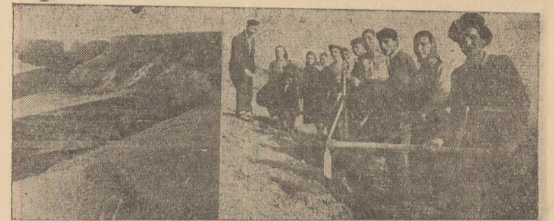
În anii ce vin, în aceste locuri sterpe, lipsite de covorul verde al ierbii, de lăstărișul des al pădurii, vor crește trufași pinii.