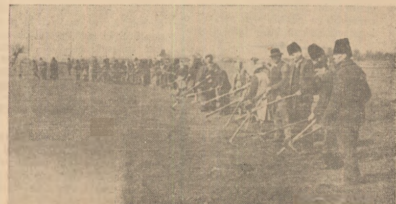
IN CLIȘEU: Curățatul pășunii la G.A.C. — Oiejde.