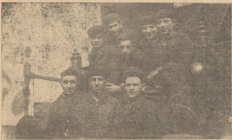
În cinstea aniversării partidului, echipa complexă de reparații de la Depoul C.F.R. Teiuș a reparat în luna martie peste plan o locomotivă cu materiale economisite, a slrîns și expediat oțelurilor tunedoreni un vagon de fier vechi. În elîșeu: Echipa complexă de reparații.

Aducîndu-și aportul pe calea scrisului, corespondenții voluntari, colaboratorii și cititorii ziarului vor contribui în mod real la extinderea experienței pozitive, la mersul nostru înainte, cei mai activi corespondenți urmînd a fi premiați.