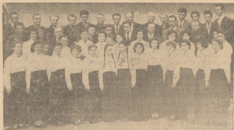
IN CLIȘEU: Corul clubului sindical C.F.R. Teiuș.

Și atunci cu siguranță că organizația de bază va putea să raporteze rezultate și mai frumoase în munca cu activul fără de partid.