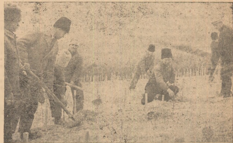
IN CLIȘEU: Plantatul viei la gospodăria agricolă de stat „Alba Iulia” — sectorul Țelna.

Deoarece ne găsim într-o perioadă destul de avansată și orice zi de întîrziere în executarea însămințărilor poate duce la pierderi serioase de recoltă, consiliul de conducere, cu ajutorul Sfatului popular comunal Oarda de Jos, poate și trebuie să termine lucrările de însămințări în timpul cel mai scurt.