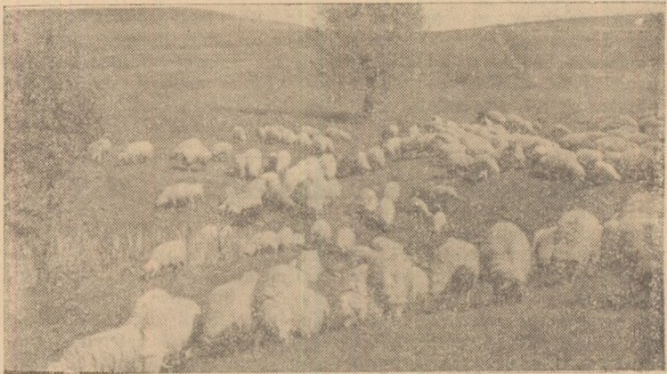
O parte din oile G.A.C. — Căpușă.