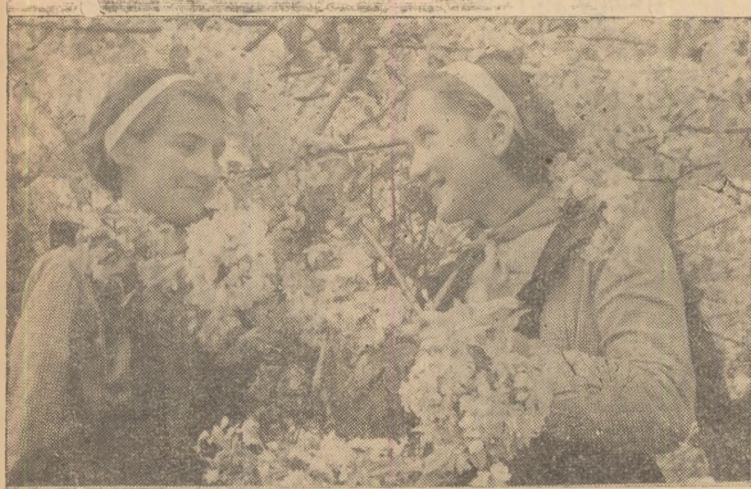
Flori ale primăverii

Sărbătorim cel de-al 17-lea 1 Mai liber. Sub roșul steag al clasei muncitoare, patria noastră crește cu fiecare ceas, se înnoiește cu fiecare clipă. Puterea noastră, încrederea noastră în ziua de azi și de mîine izvorăsc din faptul că aparținem puternicului lagăr socialist în fruntea căruia, în avangardă, cu toate flamurile desfășurate, pășește măreța Uniune Sovietică. Și nimic nu poate întinca biruitoarea noastră primăvară.