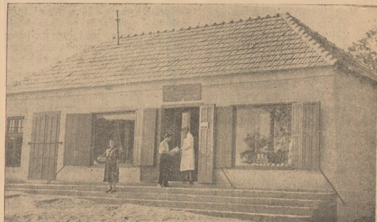
ÎN CLIȘEU: Noul local de cooperativă din Cistei, la construcția căruia a participat întregul sat.