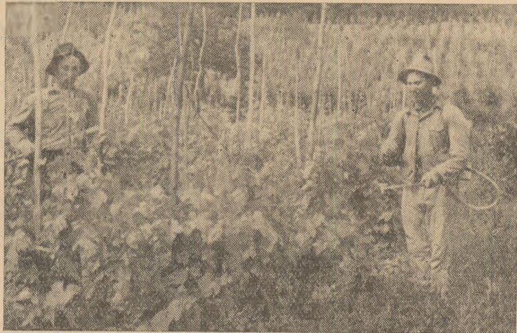
IN CLIȘEU: Stropitul viei la gospodăria agricolă colectivă „Viața nouă” din satul Țelna.

Mai sînt însă unele aspecte negative constatate cu ocazia primei ședințe de convorbire, și anume aceea că în unele cazuri se discută prea multe amănunte și se pierde din vedere problema de bază. Este bine să fie cunoscute și discutate și acestea, însă ceea ce trebuie avut în vedere trebuie să fie problema de bază de la care să pornească analiza. Prin urmare să nu se vorbească prea mult despre lucruri mărunte, iar problemele principale să fie neglijate. Acesta este un lucru esențial și trebuie să se țină cont în viitor.