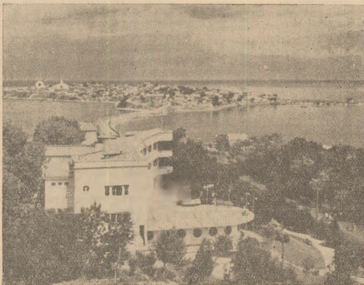
Orașul Nesebăr — Bulgaria — Stațiune balneară pe litoralul Mării Negre.

înlocuit în fabricarea parfumurilor de calitate superioară și a articolelor de cosmetică.