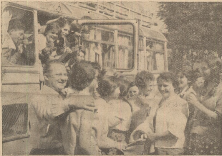
Bucurie...— Elevi din clasa X-a de la Școala medie H.C.C. din Alba Iulia, la plecarea în excursie, pentru 14 zile, pe meleagurile patriei.

Procedînd astfel, plugarii cred că s-au gîndit în sine că smulgîndu-i ochelarii, poate... va vedea mai bine.