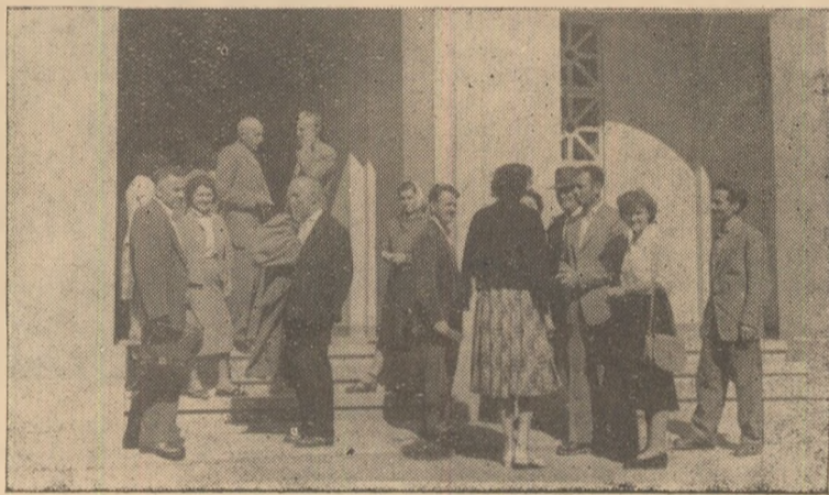
Un grup de cadre didactice în una din pauzele constăturilor.

Sărbătorind „Ziua învățătorului”, cadrele didactice și-au reafirmat dorința lor nestrămutată de a fi și în viitor demni oșteni pe tărîmul științei și culturii, de a sluji cu toate forțele cauza nobilă încredințată lor de a înstrui și educa tinerele vlăstare, continuatori ai măreței zidiri socialiste din scumpa noastră patrie.