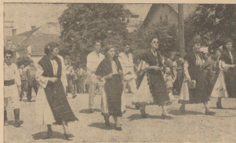
IN CLIȘEU: Tineri din Teiuș în drum spre locul unde au loc demonstrațiile cultural-sportive.