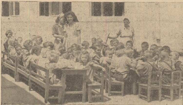
Copiii de la grădinița sezonieră din Mihail la masa de prînz.

Sporirea producției de cereale în anul viitor este o sarcină de mare răspundere. De aceea, nu trebuie precupețit nici un efort pentru executarea tuturor lucrărilor pregătitoare la un înalt nivel agrotehnic. Executarea arăturilor la adîncimea corespunzătoare, folosirea mijloacelor proprii ale gospodăriilor pentru executarea de arături de vară pe suprafețe cît mai mari, sînt sarcini centrale de mare răspundere pentru îndeplinirea cărora organizațiile de partid, comitetele executive ale sfaturilor populare de la comuna, precum și toți lucrătorii ogoarelor trebuie să-și aducă toată contribuția.