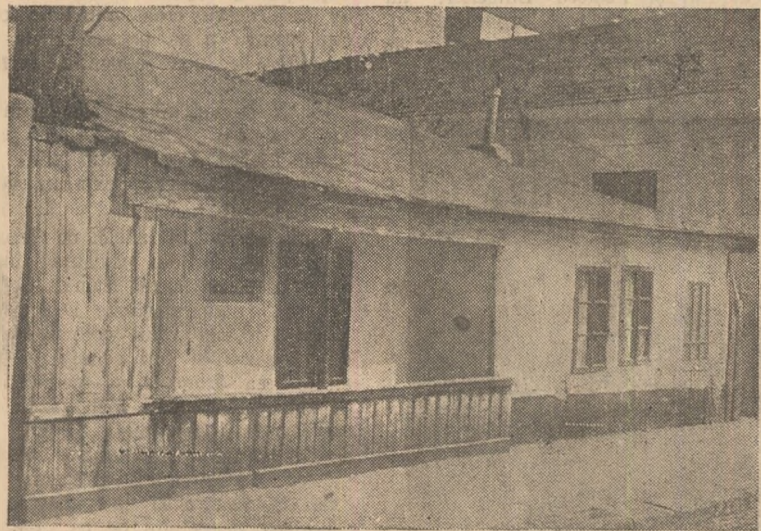
Placa și casa comemorativă unde a lucrat în ilegalitate redacția ziarului „Scînteia“ din str. Ecoului nr. 29 — București.

Ziua presei romîne va fi sărbătorită în fiecare an la 15 august — aniversarea apariției primului număr al ziarului „Scînteia“.