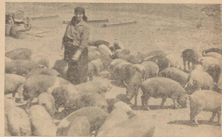
G.A.C. Teiuș — O parte din tineretul porcin la îngrășat.