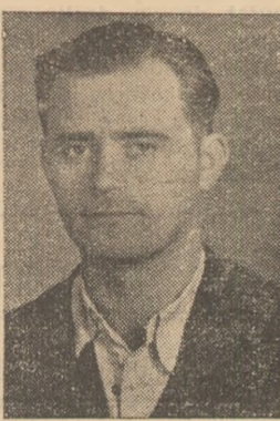
MILACI ION locuitor de președinte G.A.C.—Șard