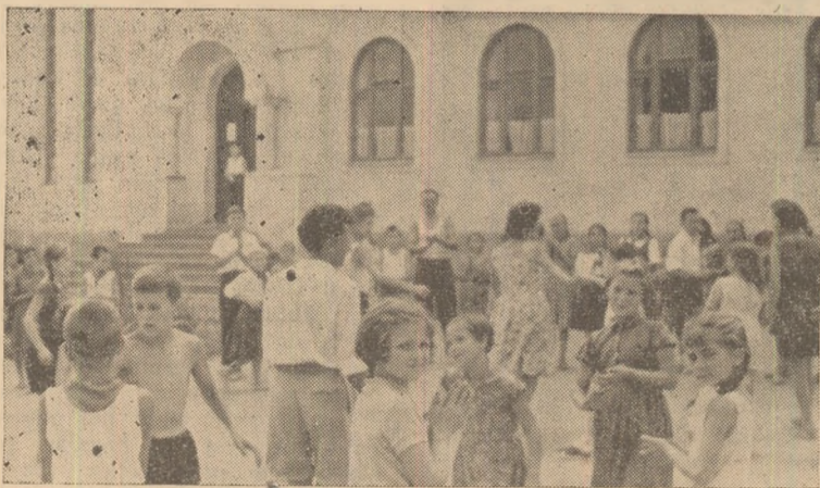
CLIPSE DE BUCURIE. — În clășeu: Pionieri și școlari aflați în vacanță la tabăra din Tăuți.

portante din aceste zile, este o sarcină de onoare trasată de partid tuturor factorilor de care depinde acest lucru. De asigurarea condițiilor defășurării în bune condițiuni a procesului de învățămînt depinde munca pe întreg parcursul unui an. De aceea, fiecare cadru didactic trebuie să se simtă mobilizat la acțiune. Și sub îndrumarea organizațiilor de partid și cu ajutorul sfaturilor populare să se facă totul, astfel ca munca de instruire și educare a tinerei generații să poată începe încă din prima zi de școală cu cele mai bune rezultate. Congresul al III-lea al partidului pune în fața școlii sarcini mari. Să fim la înălțimea sarcinilor trasate de partid. Să răspundem prin fapte grijii cu care partidul și întregul nostru popor înconjoară școala și pe slujitorii ei.