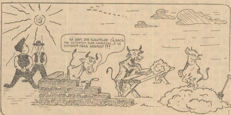
La G.A.C. — Ighiu, construirea grajdului este rămasă în urmă.

Punînd un accent deosebit pe dezvoltarea creșterii animalelor și în deosebi pe sporirea numărului de taurine din prăsilă proprie, la propunerea comunistilor, colectivității din Mihalț au hotărît de pe acum ca în anul 1962 să construiască încă 2 grajduri pentru bovine.