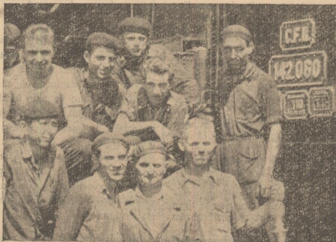
Un grup de muncitori frunțași de la Depoul C.F.R. Teiuș.