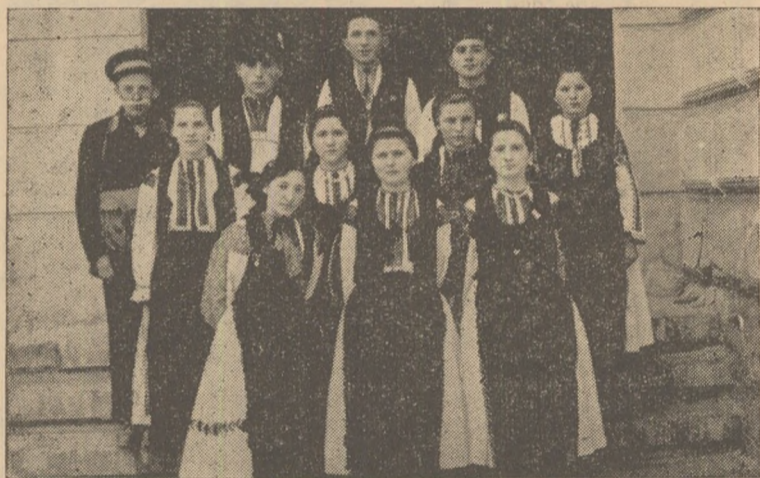
Brigada artistică de agitație de la Țelna desfășoară o vie activitate culturală.

În anii construcției socialiste li s-au dat oamenilor muncii zeci de mii de locuințe confortabile. La acestea se vor adăuga și cele 24 apartamente compuse fiecare din 2 camere, bucătărie, baie și cămară de alimente, ale blocului din centrul orașului nostru, care nu peste mult timp va fi dat în folosință. Va fi o nouă și adîncă bucurie, ce se va adăuga la cele multe pe care le trăim în vremurile de azi.