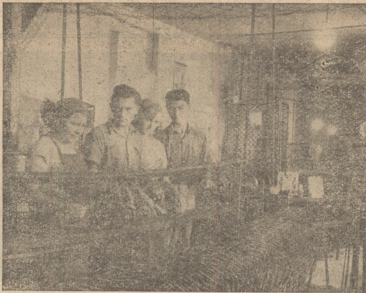
Un grup de muncitori din secția sîrmă de la I.I.L. „Horia”, secție fruntașă pe întreprindere.