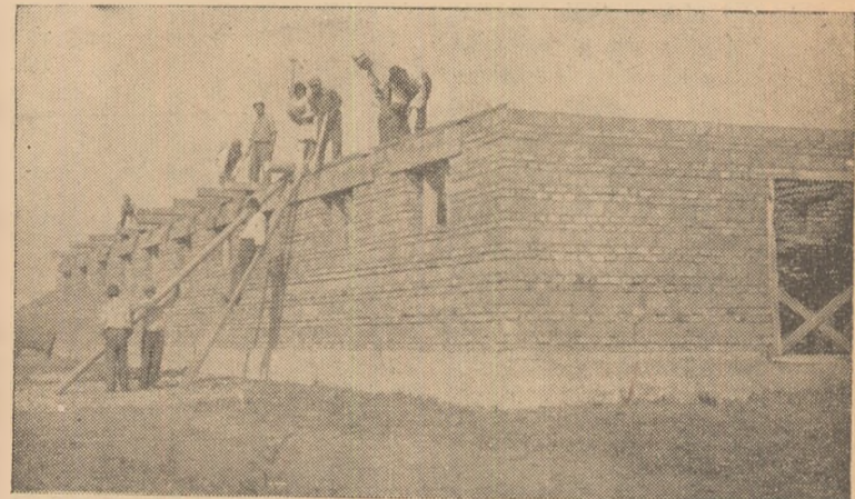
In clișeu: Grajdul în construcție — G. A. C. Teleac.

După aceea, propagandiștii repartizați pe forme de învățămînt au audiat expunerea primei teme din programul cercului sau al cursului respectiv.