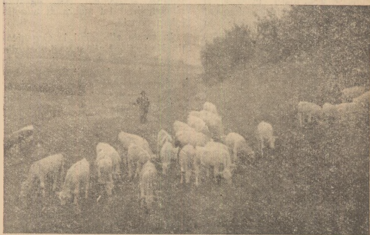
Colectivității din Obreja acordă mult interes dezvoltării creșterii animalelor.